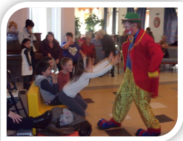
Spectacle de Noël