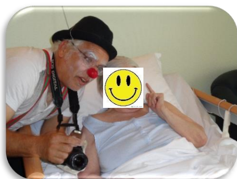
Venue des clowns