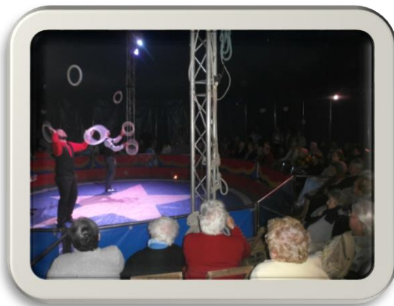
Venue du cirque