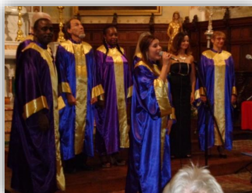
Venue du Gospel

Le partage entre adhérents et résidents autour de projets est source d'enrichissement !